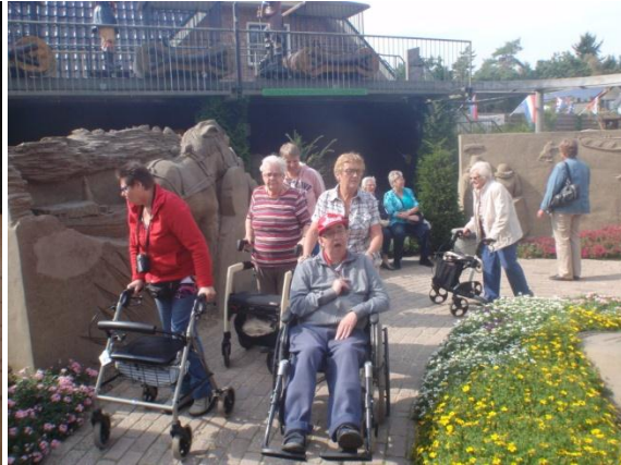
“Twee emmertjes water halen”, denken wij.