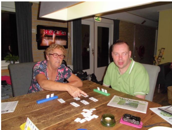
's Avonds wordt er Rummikub gespeeld en kijken we tv en hebben veel plezier ...een programma over 50 jaar TROS met Hans Liberg, waar we erg om moeten lachen. Daarna nog een optreden met veel Nederlandse artiesten. Het is al laat als we naar bed gaan!